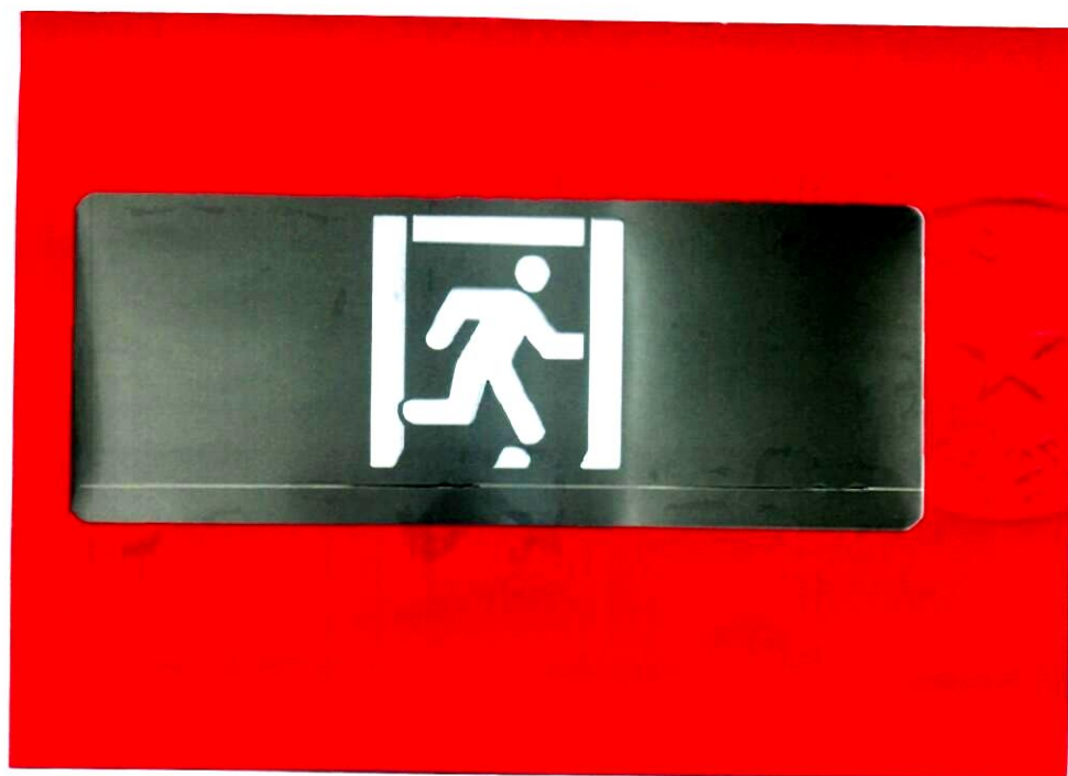
产品型号: X-BLJC-1LR0E II 1W-1410A (图 B. 2)