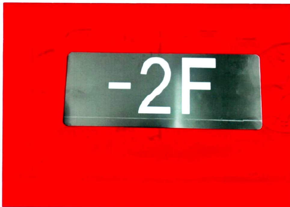
产品型号: X-BLJC-1LROE II 1W-1410A (图 B. 6 -2F)