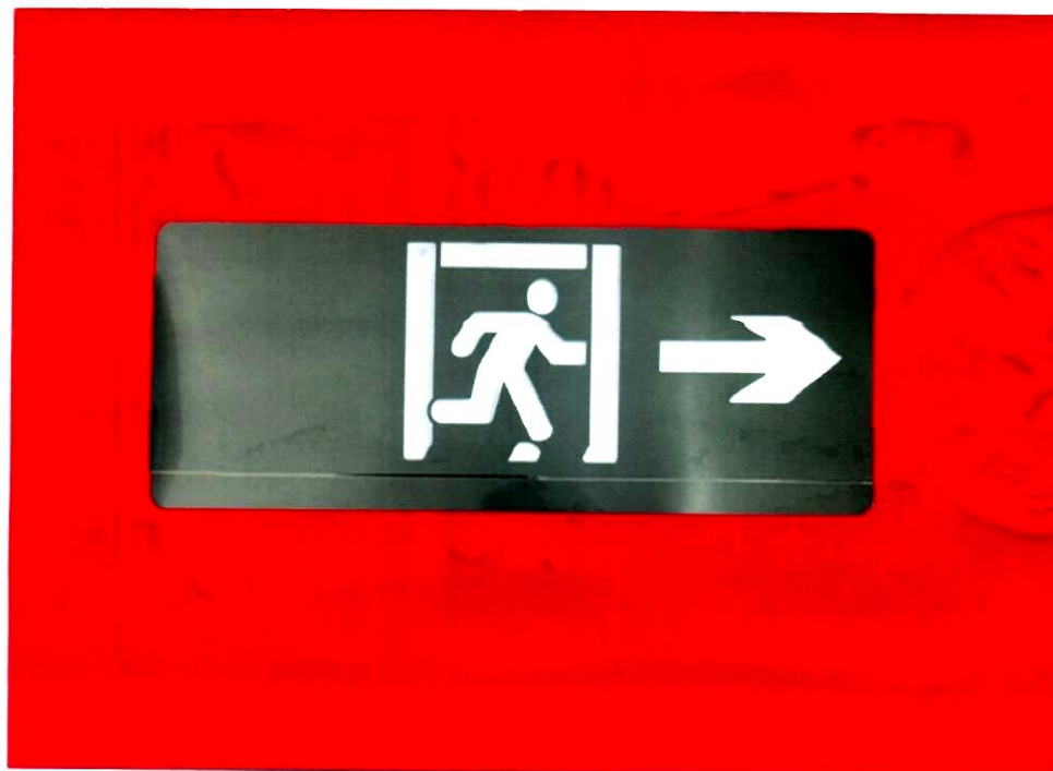
产品型号: X-BLJC-1LROE II 1W-1410A (图 B. 2+图 B. 5)