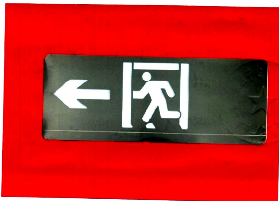
产品型号: X-BLJC-1LR0E II 1W-1410A (图 B. 1+图 B. 5)