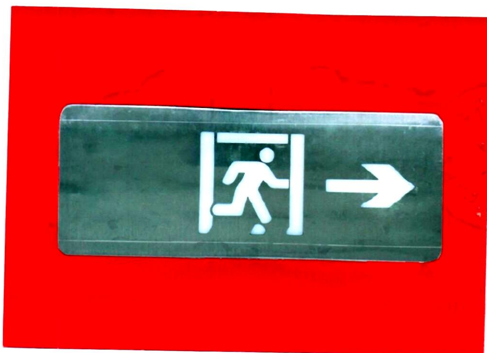
产品型号: X-BLJC-1LROE II 1W-1413 (图 B. 2+图 B. 5)