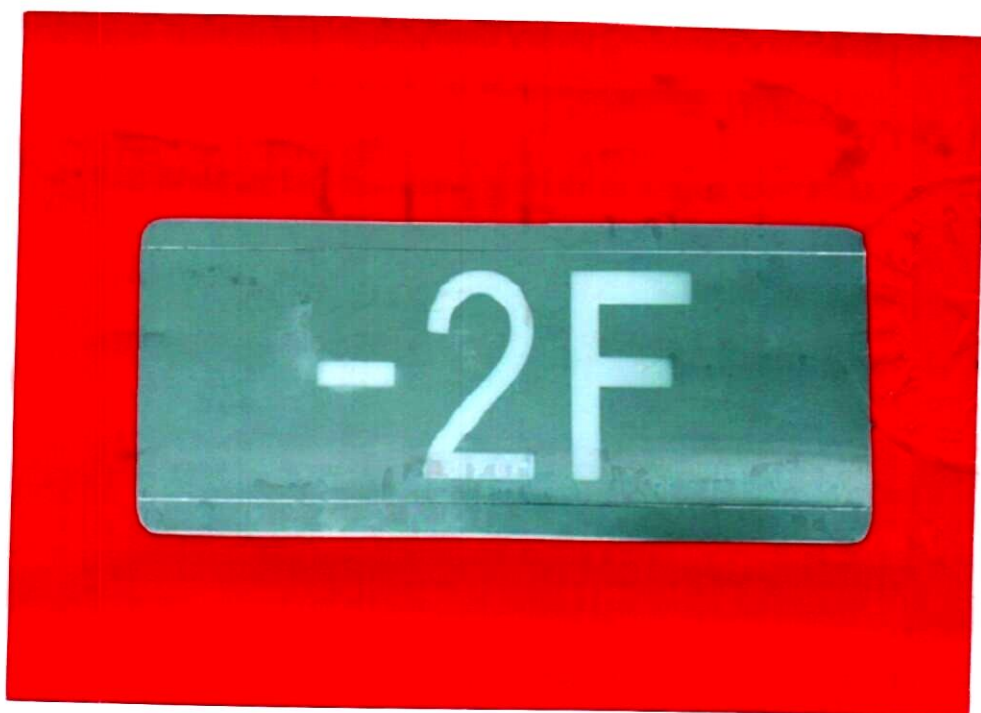
产品型号: X-BLJC-1LROE II 1W-1413 (图 B. 6 -2F)