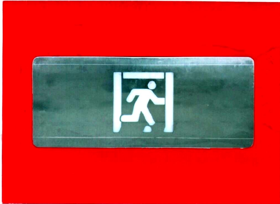
产品型号: X-BLJC-1LROE II 1W-1413 (图 B. 2)