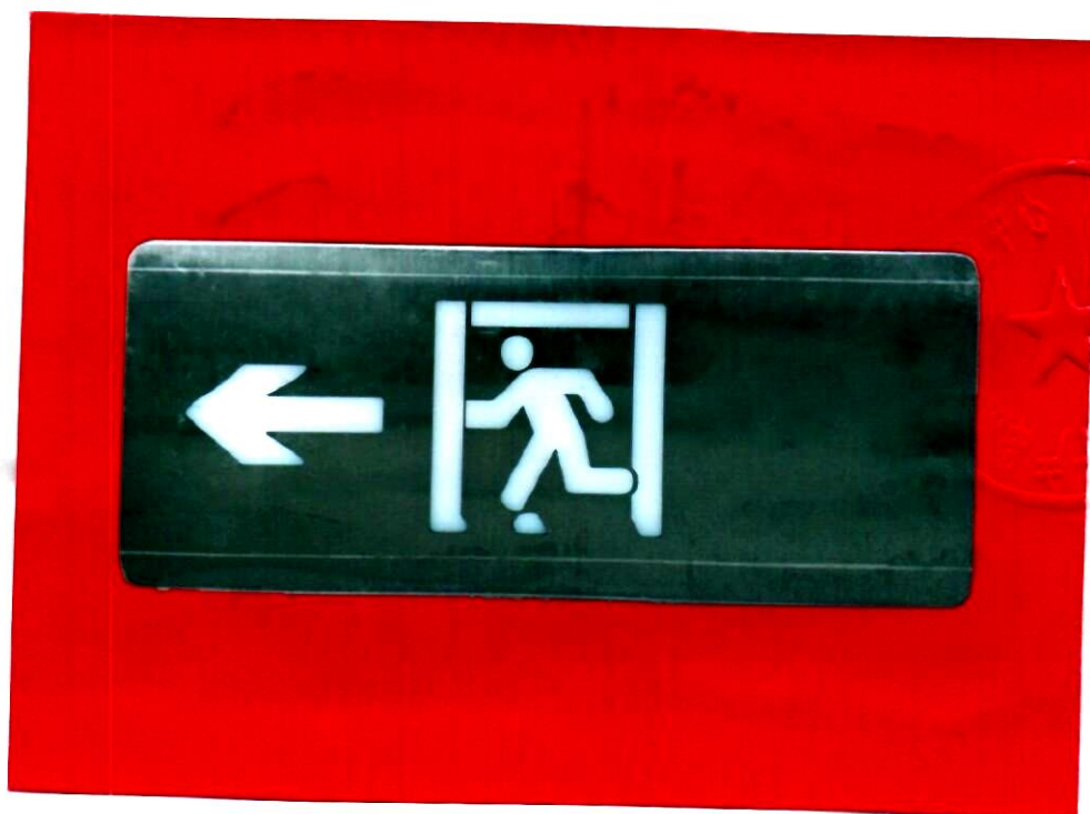
产品型号: X-BLJC-1LROE II 1W-1413 (图 B. 1+图 B. 5)